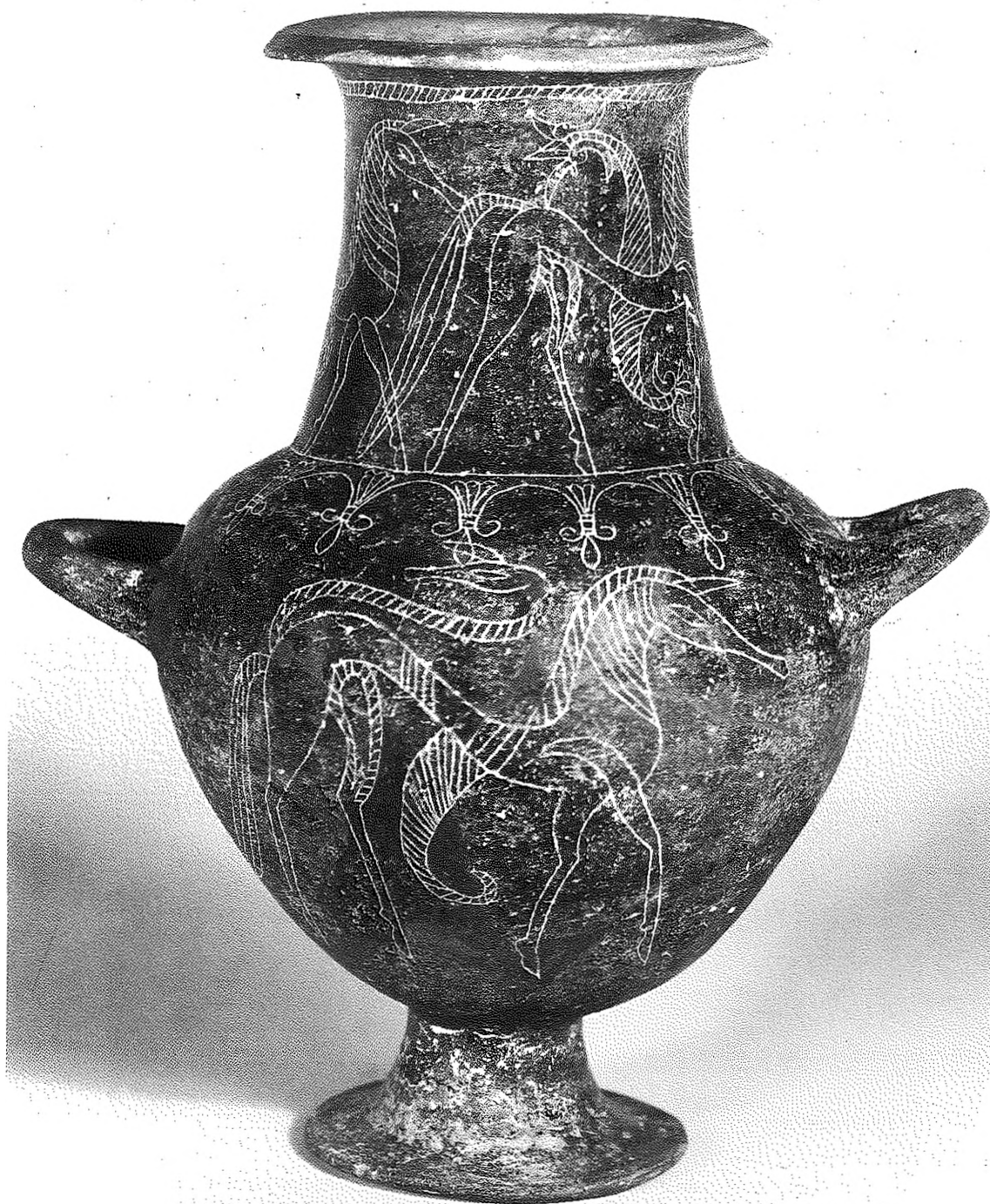
a) Karlsruhe, Badisches Landesmuseum inv. 82/4, vaso d'impasto del «Maestro di San Martino».