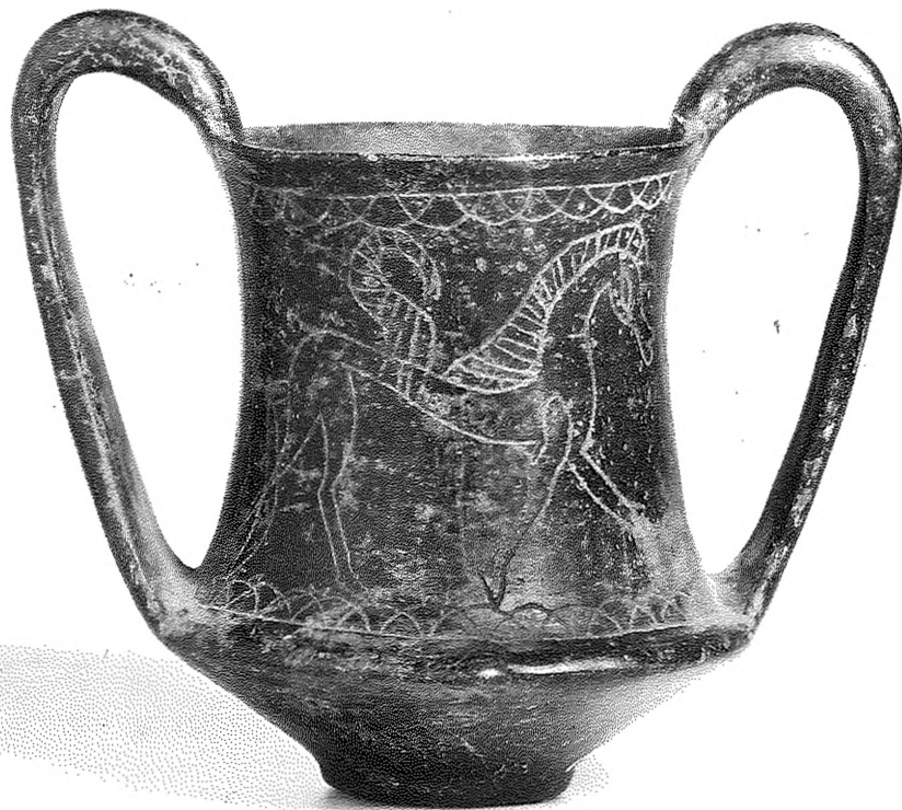
b) Amburgo, Museum für Kunst und Gewerbe inv. 1917.393, kantharos d'impasto. (foto J. Hiltman).