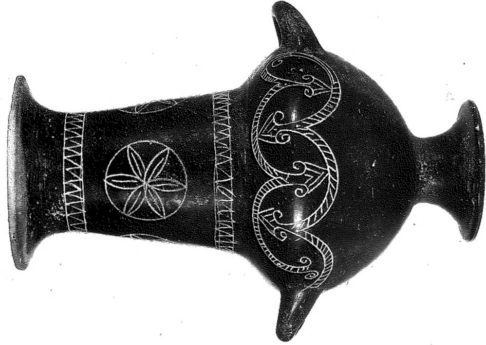
b) Berlino, Antikenmuseum SMPK inv. V.I. 4537, vaso d'impasto da Falerii. (foto U. Jung).