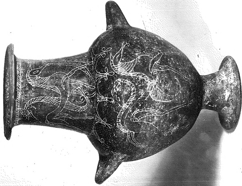
a) Karlsruhe, Badisches Landesmuseum inv. 82/4, vaso d'impasto del «Maestro di San Martino».;